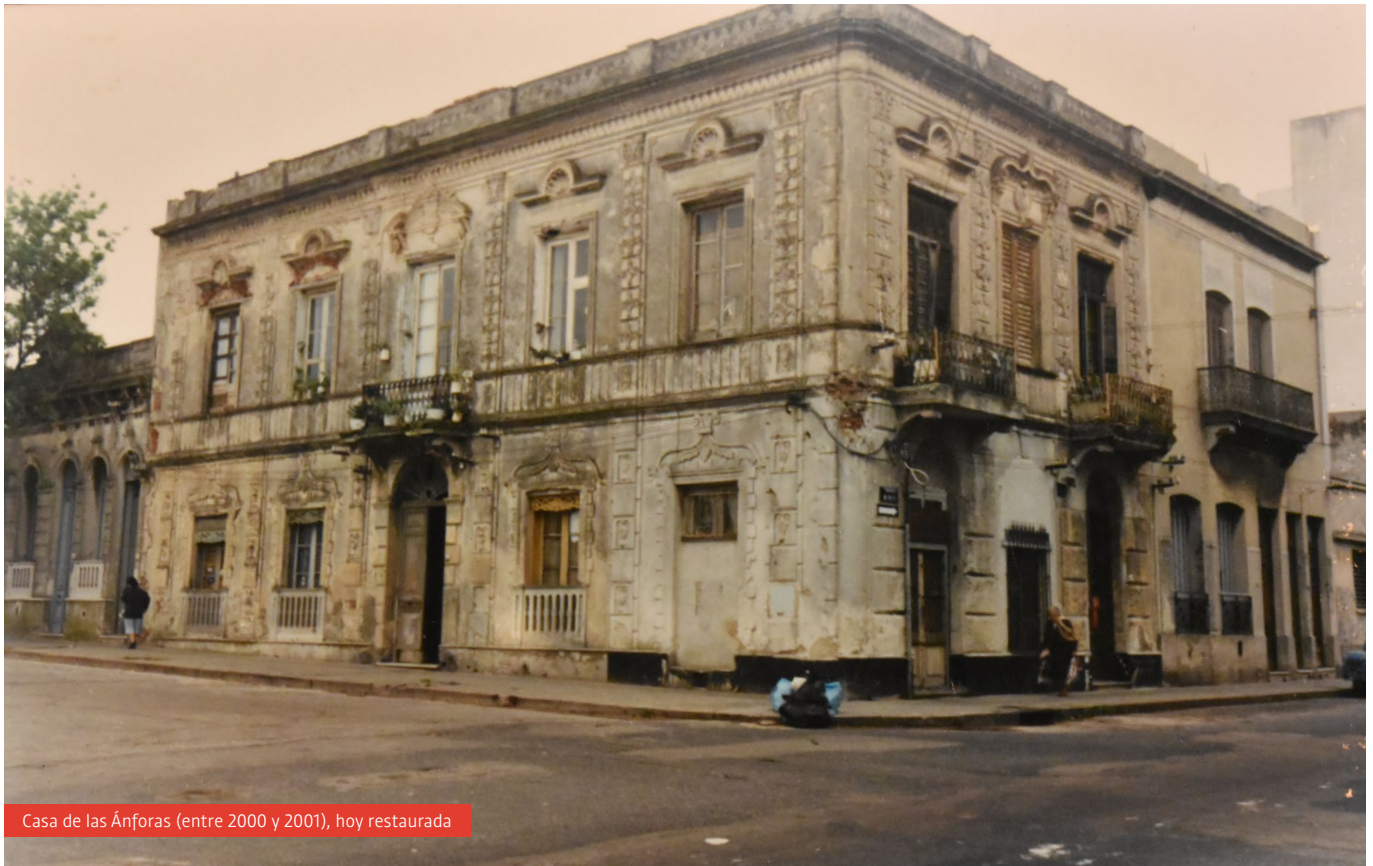
Casa de las Ánforas (entre 2000 y 2001), hoy restaurada

Distintas comunidades se asentaron en el barrio Palermo, generando así una identidad diversa. Diferentes personas gravitaron hacia la zona gracias a los bajos alquileres. Por esta razón, varios uruguayos tanto del interior del país como de la capital, al igual que inmigrantes, se vieron atraídos a la zona.