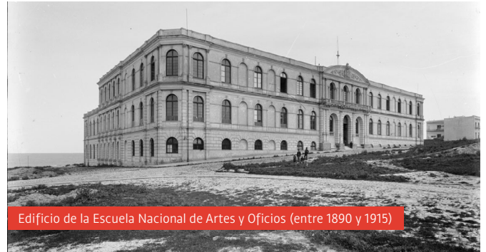
Edificio de la Escuela Nacional de Artes y Oficios (entre 1890 y 1915)

Además, los vecinos contaron en los talleres que existía otra feria, hoy extinta, en la plaza Juan Ramón Gómez. 30