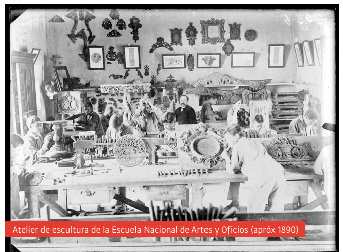
Atelier de escultura de la Escuela Nacional de Artes y Oficios (aprox 1890)

El turno de la mañana se llamaba Suecia escuela N° 16, el turno de la tarde se llamaba Aurelia Viera, no recuerdo número. Actualmente es escuela N° 16 Suecia de tiempo completo ” 33