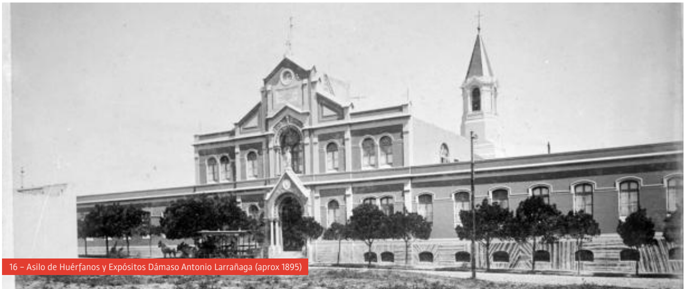
16 - Asilo de Huérfanos y Expósitos Dámaso Antonio Larrañaga (aprox 1895)

Valores la saca mi primo primero, parte de mi familia. Nosotros venimos de un proceso de candombe de mi tía abuela, que es cantante de candombe cuando el candombe no era moda ni era todo lo lindo que es ahora, que uno lo puede disfrutar plenamente. (...) [Valores] Nació acá, en el comedor de esta casa, jugando, como dice la canción [“Sueño de Niño”] si ustedes escucharon el disco de Valores de Ansina [“Coloreando sueños”]. (...) en este comedor donde estamos ahora era donde jugábamos nosotros, como nosotros íbamos todo el tiempo a ver a mi tía a los ensayos jugábamos a la comparsa. Y ahí empezó todo, en un juego, en un sueño de niño.” 57