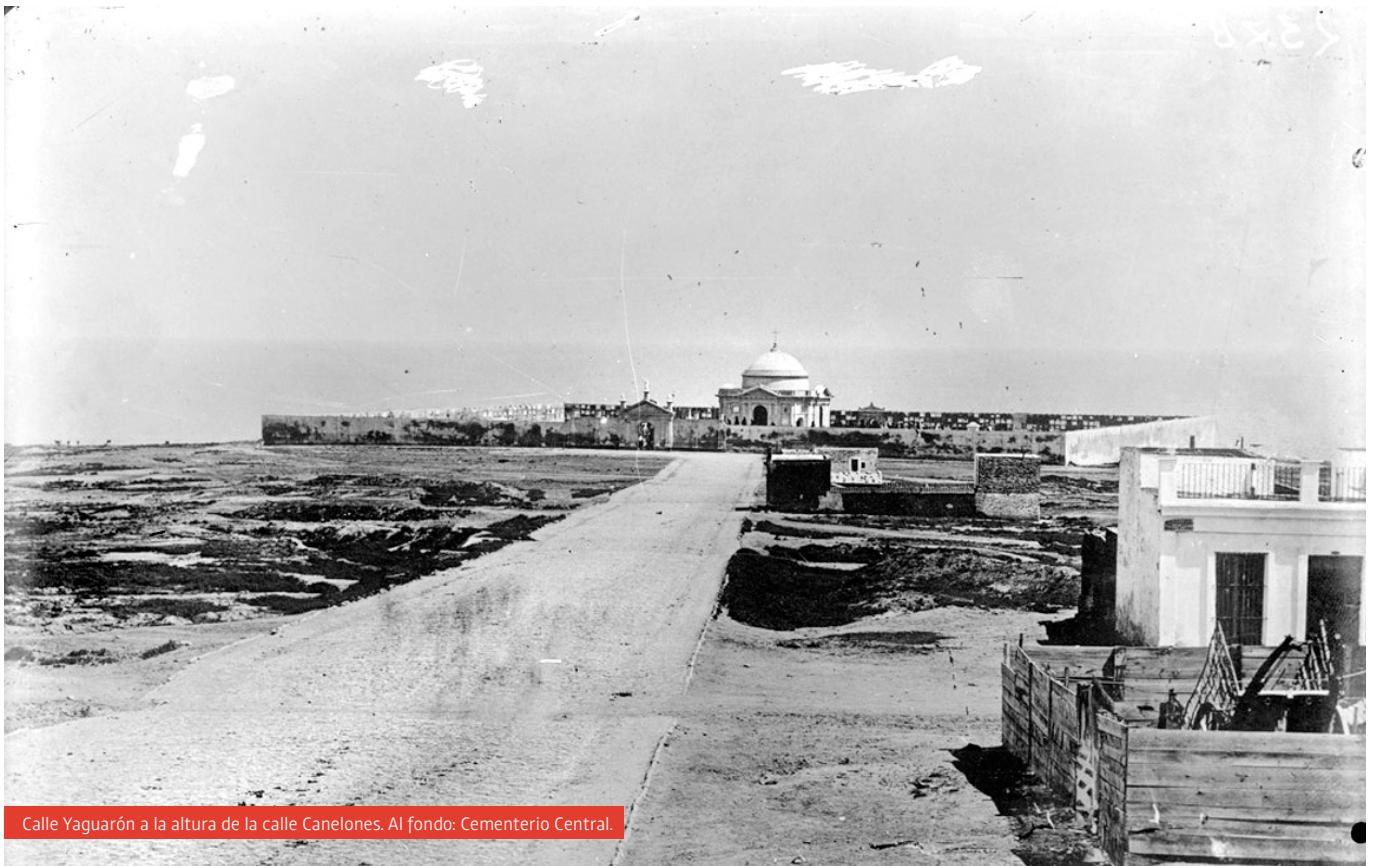
Calle Yaguarón a la altura de la calle Canelones. Al fondo: Cementerio Central.

En cuanto a su denominación, la tradición oral del barrio, recogida por Zito, indica que Palermo recibió su nombre de los inmigrantes italianos que se asentaron en la zona en el siglo XIX. Sería gracias al “Almacén de Comestibles de la Nueva Ciudad de Palermo”, abierto por una familia italiana afincada en 1863, que el nombre se popularizó. Aunque no se sabe con certeza, se confirma la existencia de dicho negocio gracias a una foto de alrededor de 1863 que muestra el cementerio central y algunas casas cercanas. 4 Desde entonces, Palermo ha crecido y cambiando, creando sus propias dinámicas e identidad, alimentada por sus vecinos y las distintas culturas que conviven en el barrio. A continuación se explorará esa diversidad y algunas de las dinámicas barriales que caracterizan su cotidianidad.