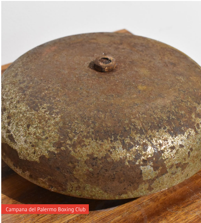
Campana del Palermo Boxing Club