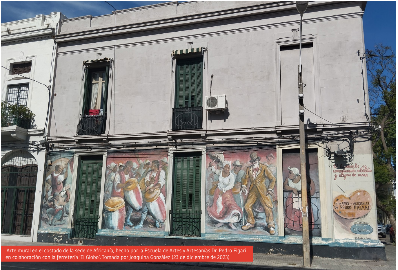
Arte mural en el costado de la sede de Africanía, hecho por la Escuela de Artes y Artesanías Dr. Pedro Figari en colaboración con la ferretería 'El Globo'. Tomada por Joaquina González (23 de diciembre de 2023)

Así, la tradición y la cultura del candombe se pasa de generación en generación, manteniéndose vivas en la sociedad. Esto se refleja en la actualidad no sólo en esa relación con las generaciones pasadas, sino en cómo reproducen esas interacciones con las generaciones futuras. Maël continúa: