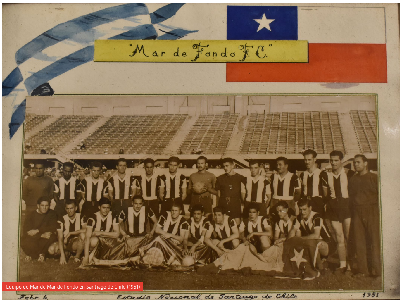
Equipo de Mar de Mar de Fondo en Santiago de Chile (1951)