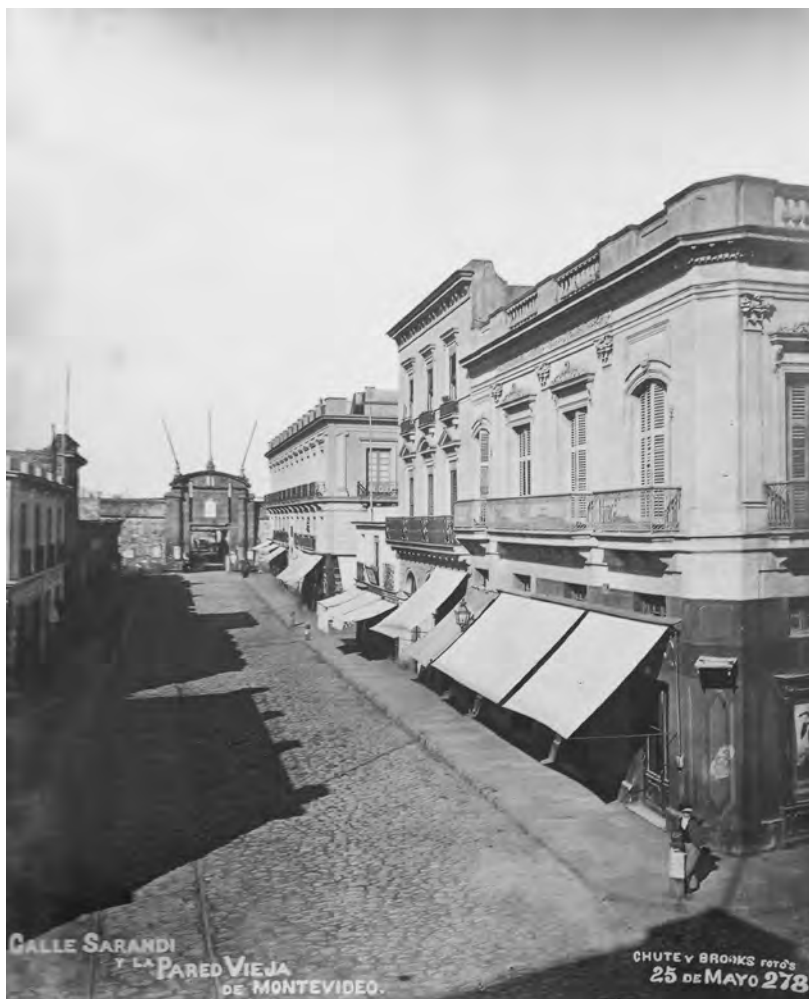
Calle Sarandí y la pared vieja de Montevideo