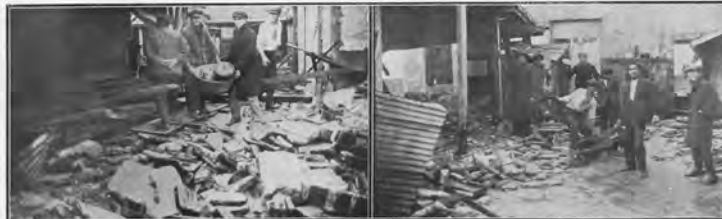
En el conventillo de la calle Durazno y Ciudadela, después del derrumbe. Buscando menaje de cocina entre los escombros