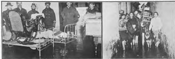
Interior de una pieza en la casa situada en la calle 25 de Mayo e Ingeniero Monteverde, invadida por las aguas