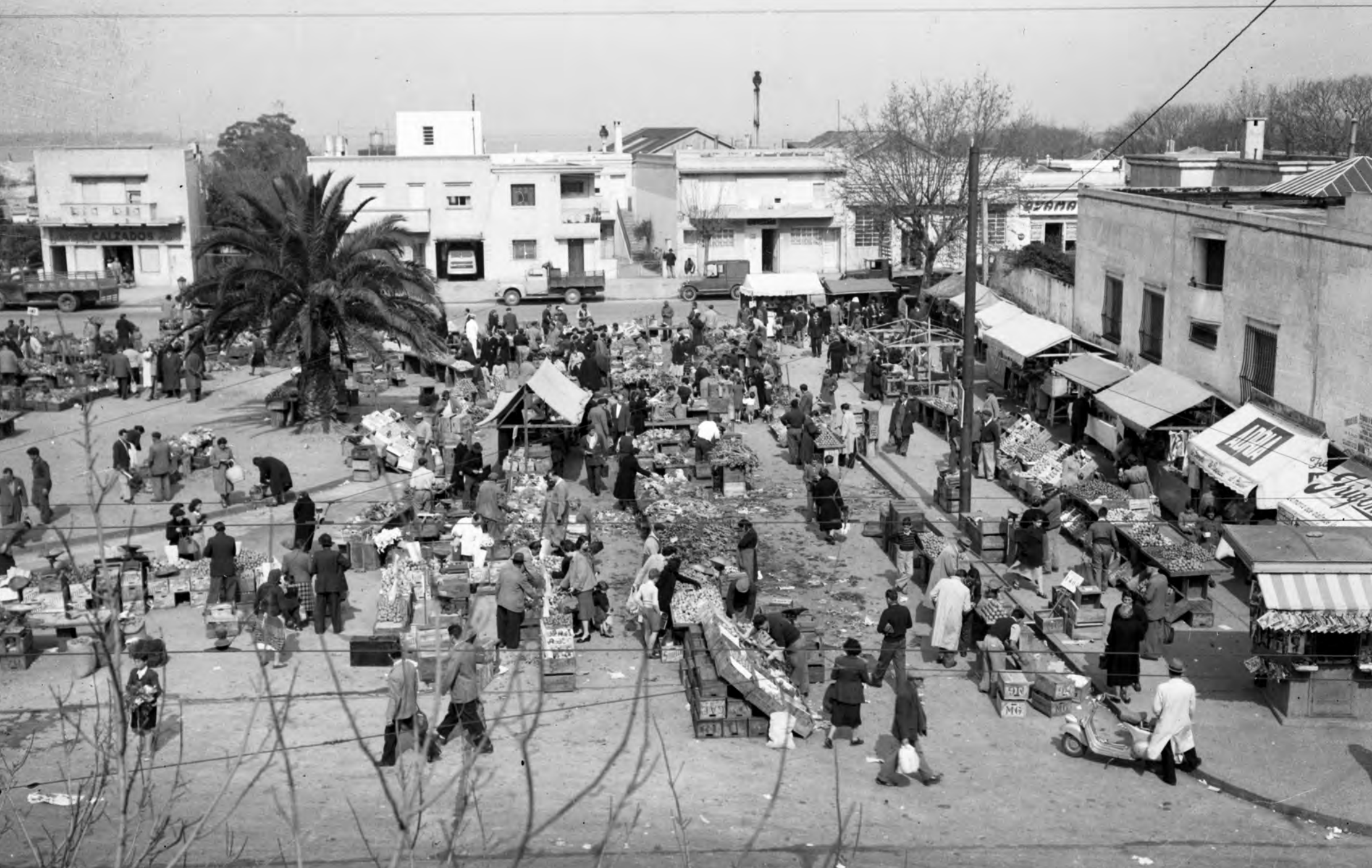
Feria barrial en actual plaza Soldados Orientales de San Martín (Capurro-Bella Vista). 1953 Archivo Nacional Imagen y la Palabra (ANIP), SODRE. Índice General. Ferias Municipales en los Barrios. Espacio 7.