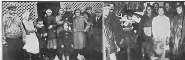
Familia que escapó milagrosamente de ser víctima del derrumbe de la fundición ubicada en la calle Aurora