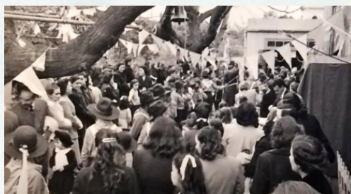
Fotografía: Actividades de una kermes realizada en el patio del Colegio Corazón de María en la década de 1950. s.d.

Un aspecto interesante del barrio es la existencia de diversos centros educativos con variadas propuestas que en sus orígenes recibían fundamentalmente a niños y niñas del barrio y que actualmente tienen una convocatoria más amplia. Además de los ya mencionados Pallotti y Corazón de María se han sumado la UDE (Universidad de la Empresa), el Liceo Adventista, el Colegio Nueva Cultura, el Jardín Collage, el Atelier Taita y otros centros de atención especializada. Fuera de él, pero en el borde, encontramos los servicios escolares públicos gratuitos: Escuelas Lavalleja y Panamá, Costa Rica y Edmundo D. Amicis, Armenia y Florencio Sánchez, la Escuela Abraham Lincoln, las Escuelas Especiales 197 y 231. Todos ellos inciden directamente en la identidad barrial. Cabe mencionar que pese al crecimiento poblacional todavía existe un déficit en la cantidad de escuelas públicas de la zona. 14