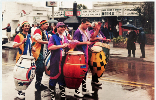
Fotografía llamadas por Luis Alberto de Herrera, 50 años de la Comisión Fomento Larrañaga, Ana Pehar, Acervo Comisión Fomento Larrañaga, Montevideo 1998

A partir de 2003, una tardecita de sábado de cada mes de enero, se realiza la tradicional fiesta del candombe en la “Llamada de Luis A. de Herrera”. Es una hermosa fiesta que se hace realidad gracias al apoyo de los comercios de la zona y de los organismos oficiales que autorizan el uso del espacio y facilitan su organización. La presencia gratuita de las comparsas invitadas y de los vecinos y vecinas —mayores, jóvenes, niños y niñas— que se acercan a la avenida son el “corazón y la alegría” de la fiesta. Cada año, organizada por la Comisión Fomento Larrañaga, la “Llamada” nos convoca a encontrarnos y disfrutar con un tema, con un nuevo lema... ¡un nuevo desafío! 17