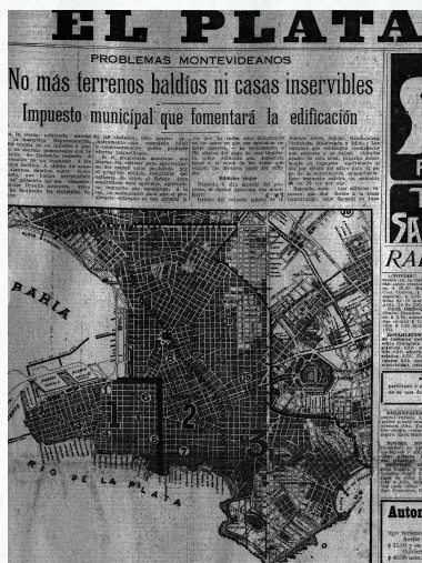
El Plata, Diario de la tarde, Montevideo, 8 de octubre de 1920.