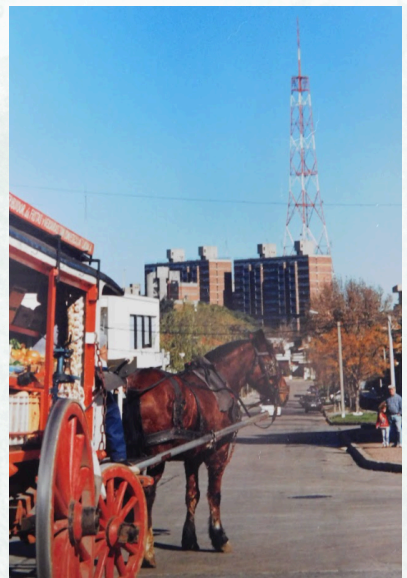
Fotografía del carro ambulante de venta de frutas y verduras "Lasala". Al fondo se observa las torres del Complejo Bulevar y la antigua antena del ex Canal 5, Ana Pehar, Acervo Comisión Fomento Larrañaga, Montevideo, 1998.