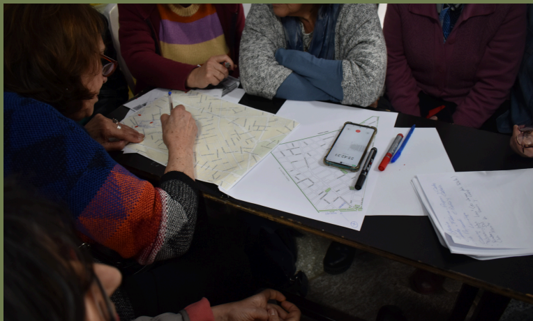
Fotografía: Vecinos participan del primer taller realizado el 9 de setiembre, en el Barrio Larrañaga, en el marco del proyecto "Cuenta la ciudad desde tu barrio", como parte de las actividades por los 300 años de Montevideo. Marcio Souza. Colección personal Eliana Crusi, Montevideo, 2023

La revista surge como resultado del conocimiento generado durante los tres talleres llevados a cabo en el barrio Larrañaga, en el marco de la conmemoración de los 300 años de la ciudad de Montevideo. Estos talleres son parte de las líneas del trabajo establecidas por el Convenio entre la Intendencia de Montevideo (IM) y la Facultad de Humanidades y Ciencias de la Educación (FHCE), en particular el proyecto "Cuenta la ciudad desde tu barrio". El objetivo de estas instancias fue rescatar la historia y la memoria del barrio a través del diálogo con los vecinos y las vecinas.