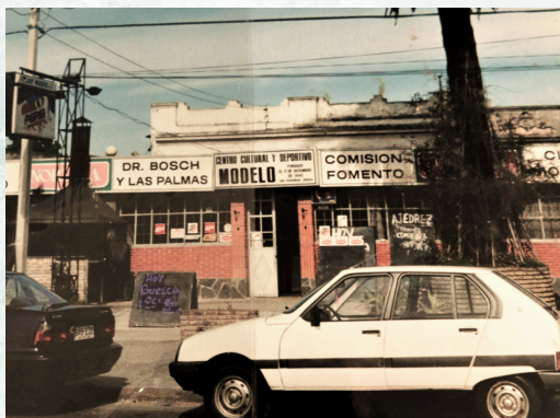
Fotografía del Centro Cultural y Deportivo Modelo del barrio Dr. Bosch y Las Palmas, actual barrio Larrañaga, ubicado en la avenida Luis Alberto de Herrera y Canstatt. Donde funcionó la Comisión Fomento del barrio Dr. Bosch y Las Palmas

En Luis Alberto de Herrera entre Canstatt y Arrieta se erige la sede del "Club Social y Deportivo Modelo" establecido en 1942. El club no se vincula al Mercado ni al Frigorífico, a pesar de su proximidad geográfica. Desde su fundación, ha sido un punto de encuentro para el vecindario donde se practicaron diversas actividades como patinaje, hockey, así como ajedrez, bochas y billar. Era un espacio que fusionaba lo deportivo con lo social, sirviendo como lugar de recreación y convivencia para la comunidad local. Actualmente, intenta recuperar la actividad de integración social que fuera objetivo de su creación.