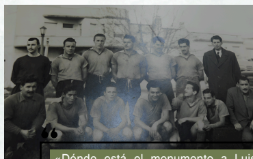
Primeros jugadores del Boston River, s.d.

«Dónde está el monumento a Luis Batlle Berres había una preciosa fuente con un reloj de sol, la llamábamos Fuente del Sol y detrás de la quinta de Caviglia estaba la cancha de Boston River.» 5