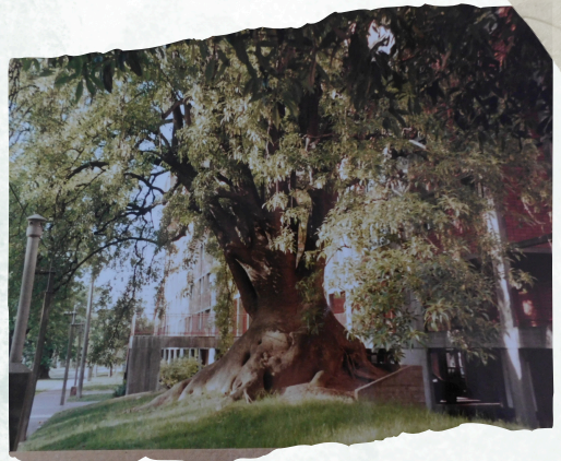
Fotografía del ombú centenario ubicado sobre la vereda del Complejo Bulevar, Ana Pehar, Acervo Comisión Fomento Larrañaga, Montevideo, 1998

Eran tiempos de la Niboplast (previo al incendio), de la Crush, de la “casa de citas” en Quijote o de la canchita del Santa Beatriz atrás del Canal 5, que solo tenía tres galpones sobre Bulevar. Un Canal 5 con “Mi Abuelito” o un poco después con la llegada del “Hada Rosada”, ruido de chapas incluido cuando llovía y ni te cuento si caía granizo.