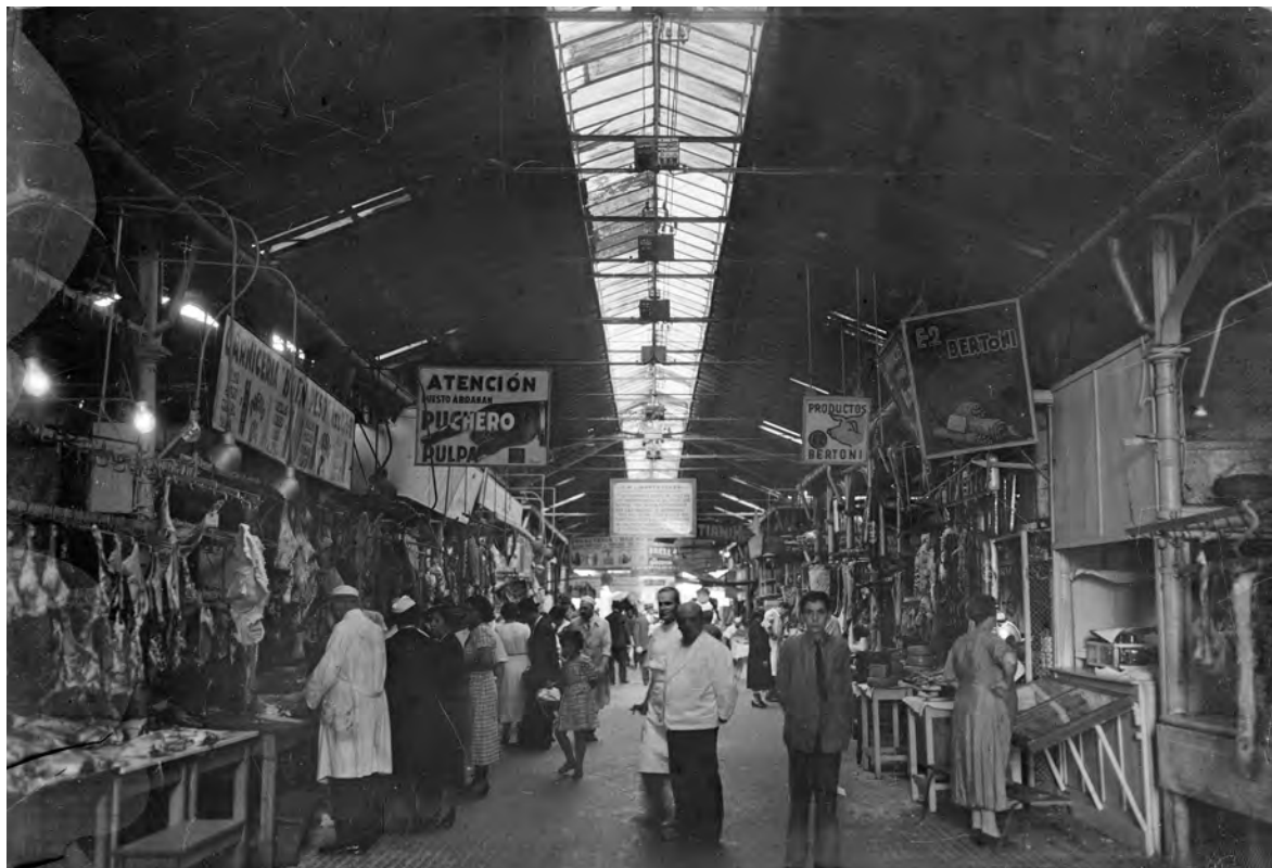
Interiores del Mercado Central, calle Ciudadela entre Reconquista y Canelones, Ciudad Vieja, alrededor de 1940. Foto 1016FMHB.

que se inauguró en 2021 tras darle cierre al funcionamiento del tradicional Mercado Modelo.