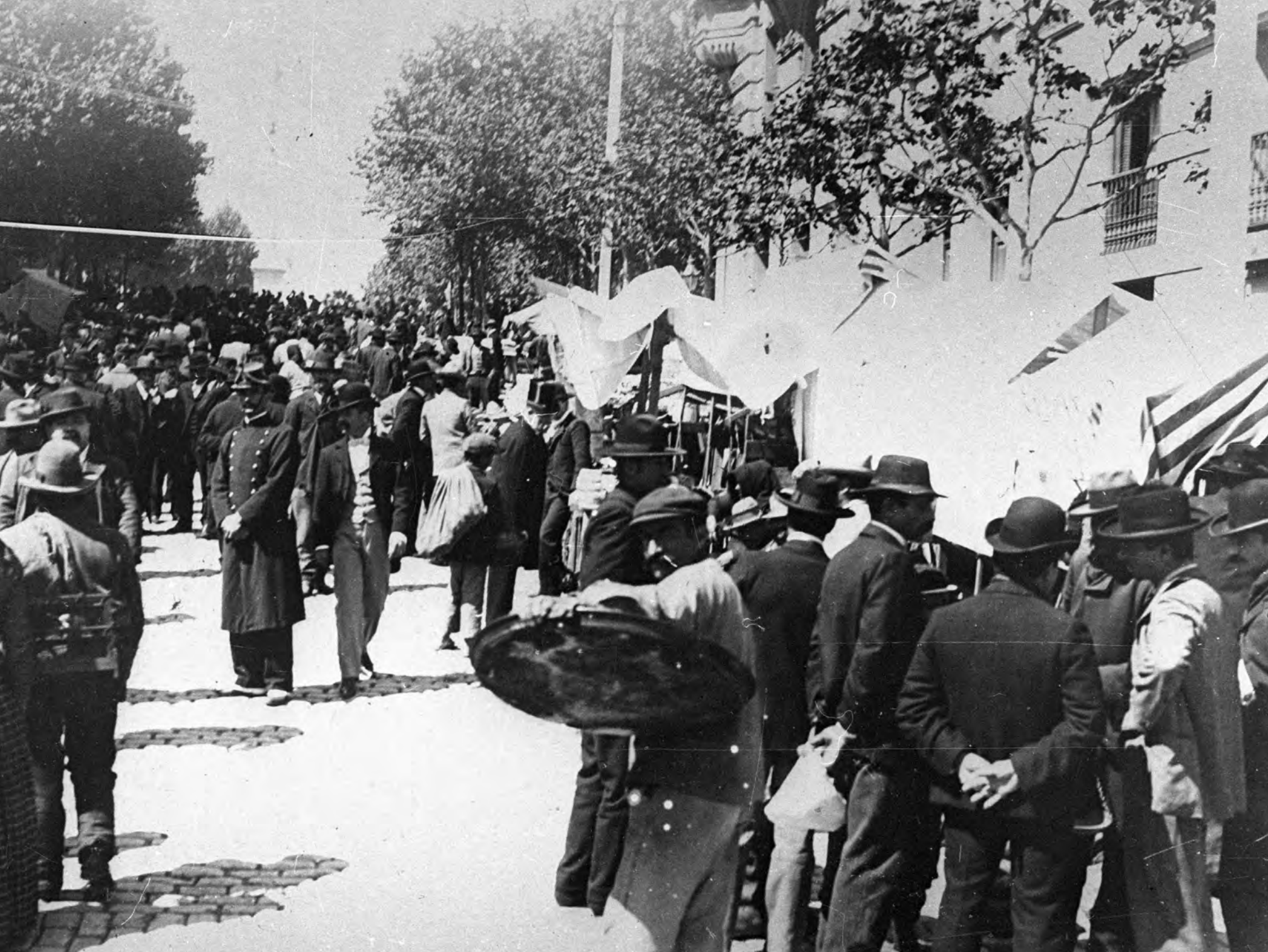
Fainasero en la feria de la calle Yaro, actual Tristán Narvaja, barrio Cordón, 1920. Foto 1467FMHB.

Fainá Un clásico histórico y actual de Montevideo es el fainá, compañero infaltable de la pizza y de la muzzarella, que, juntos, cobran una identidad propia denominada pizza o muzzarella a caballo.