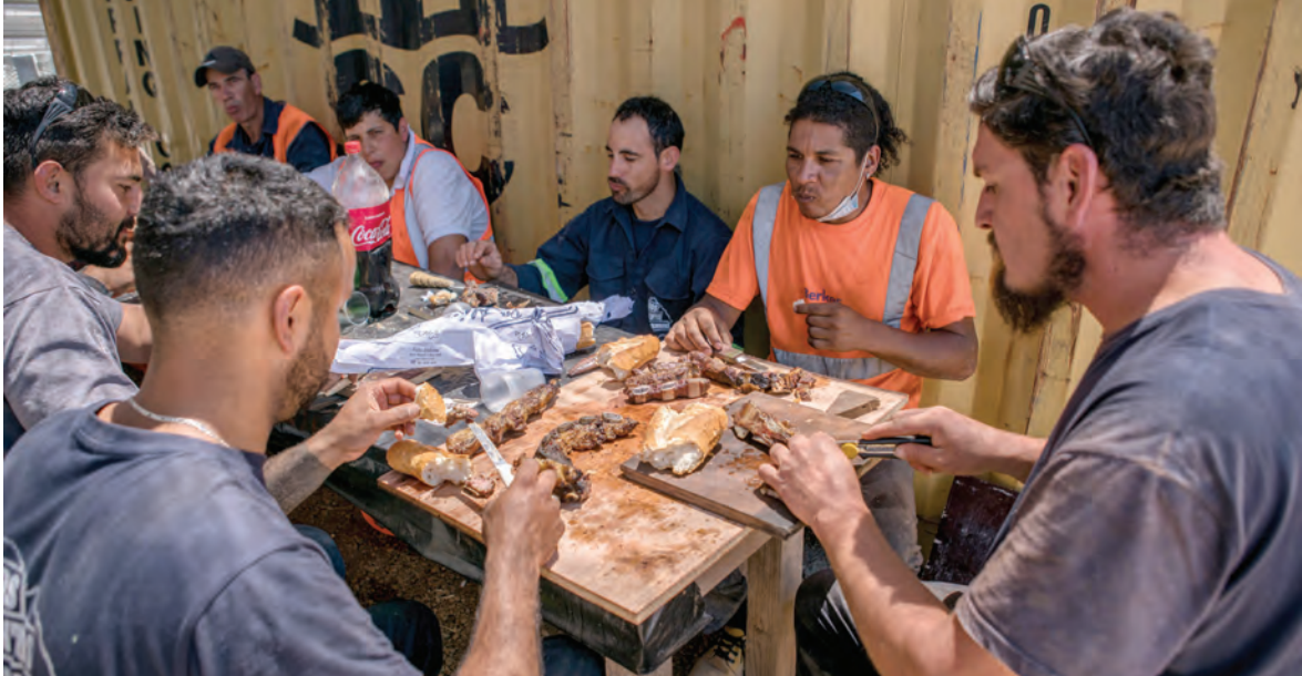
Asado de obra durante la construcción del túnel de avenida Italia, 20 de noviembre de 2020. Fotos: 84489fMCMMA Y 84486fMCMMA.

Las imágenes ilustran la preparación y la comensalidad de un asado de obra montevideano, organizado por trabajadores de la construcción en medio de la jornada laboral. En este caso, se utilizó un mediotanque, aunque usualmente estos tipos de asados se hacen de forma más rudimentaria, con una parrilla apoyada sobre algún objeto como un bloque de hormigón o incluso sobre el cordón de la vereda.