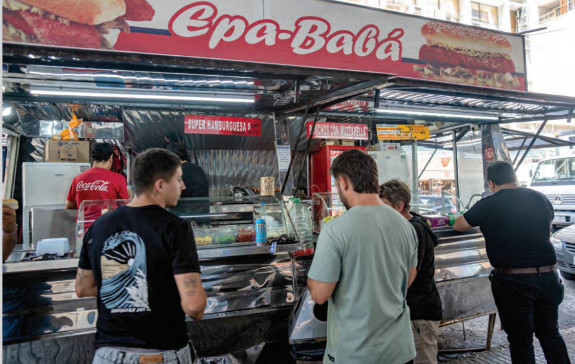
Arriba: Carro de hamburguesas y chorizos Epa-Babá, en la esquina de Paraguay y 18 de Julio, 15 de enero de 2025. Foto 103559FMCMA. Abajo: Vendedor de panchos en carrito en 18 de Julio y Yaguarón, Centro, 14 de enero de 2013.