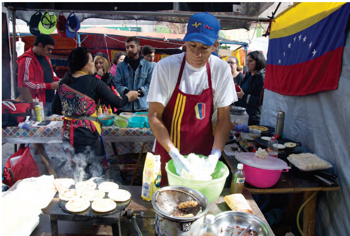
Puesto La Gran Arepa en la feria de Tristán Narvaja, entre Uruguay y Paysandú, 28 de abril de 2019.

los sabores de la cotidianidad montevideana.