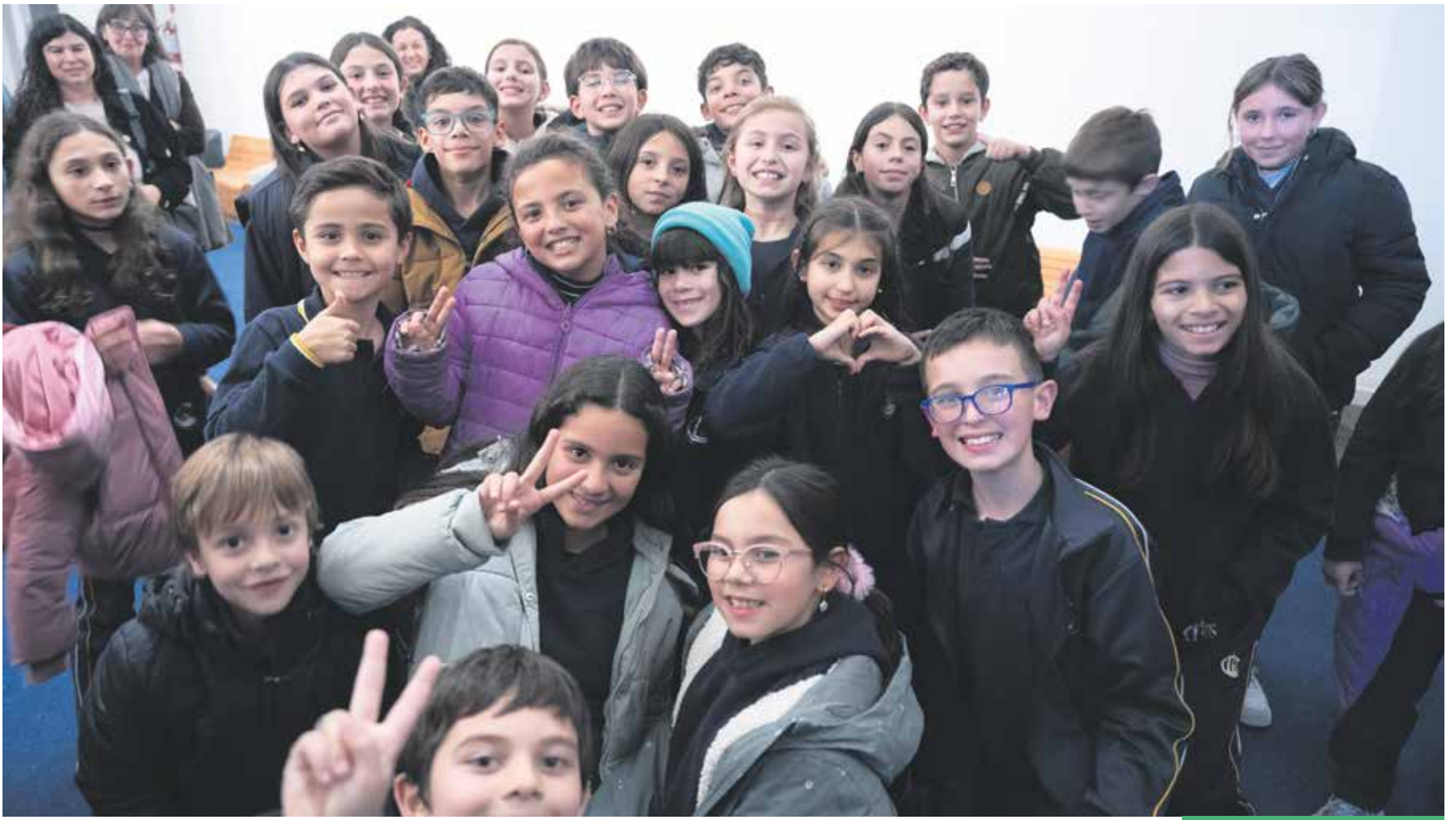
Alumnas y alumnos del Colegio Nuestra Señora de Luján, ganador del premio Sello Más Verde+.

Estudiantes del Colegio Nuestra Señora de Luján compartieron su alegría tras obtener el Sello Más Verde+. Además, otras instituciones y organizaciones distinguidas valoraron un reconocimiento que impulsa a reforzar el compromiso con el ambiente.