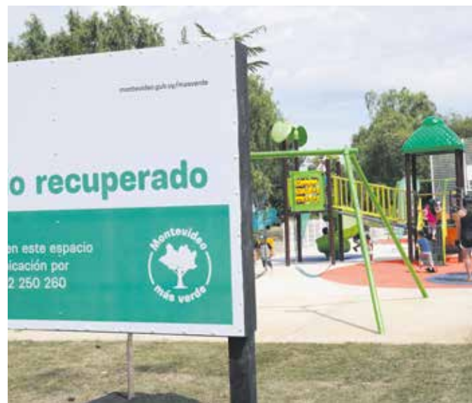
Inauguración de la plaza Parque Guaraní.

“Este programa logró evitar que esas casi 200 mil toneladas que se recogieron desde 2022 y se siguen recogiendo hasta ahora, no hayan terminado afectando los humedales o contaminando el ecosistema de las playas y del mar”, observó la gerente ambiental y agregó: “Fue realmente impactante desde el punto de vista ambiental lograr sacar del ecosistema esos residuos y darles una disposición final correcta”.