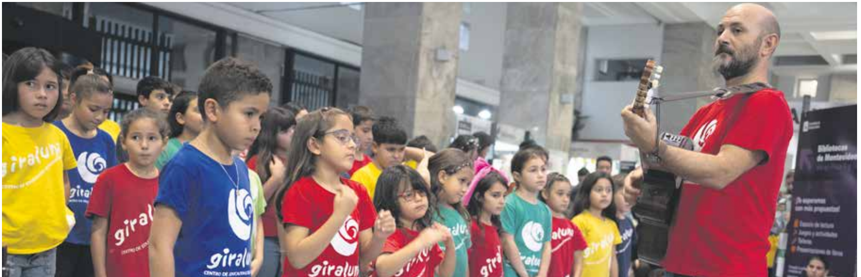
Actividad durante la 23ª edición de la Feria del Libro Infantil y Juvenil en la IM.