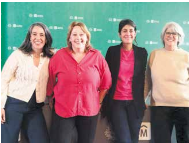
Entrega premio y distinciones del Sello Montevideo Más Verde+.