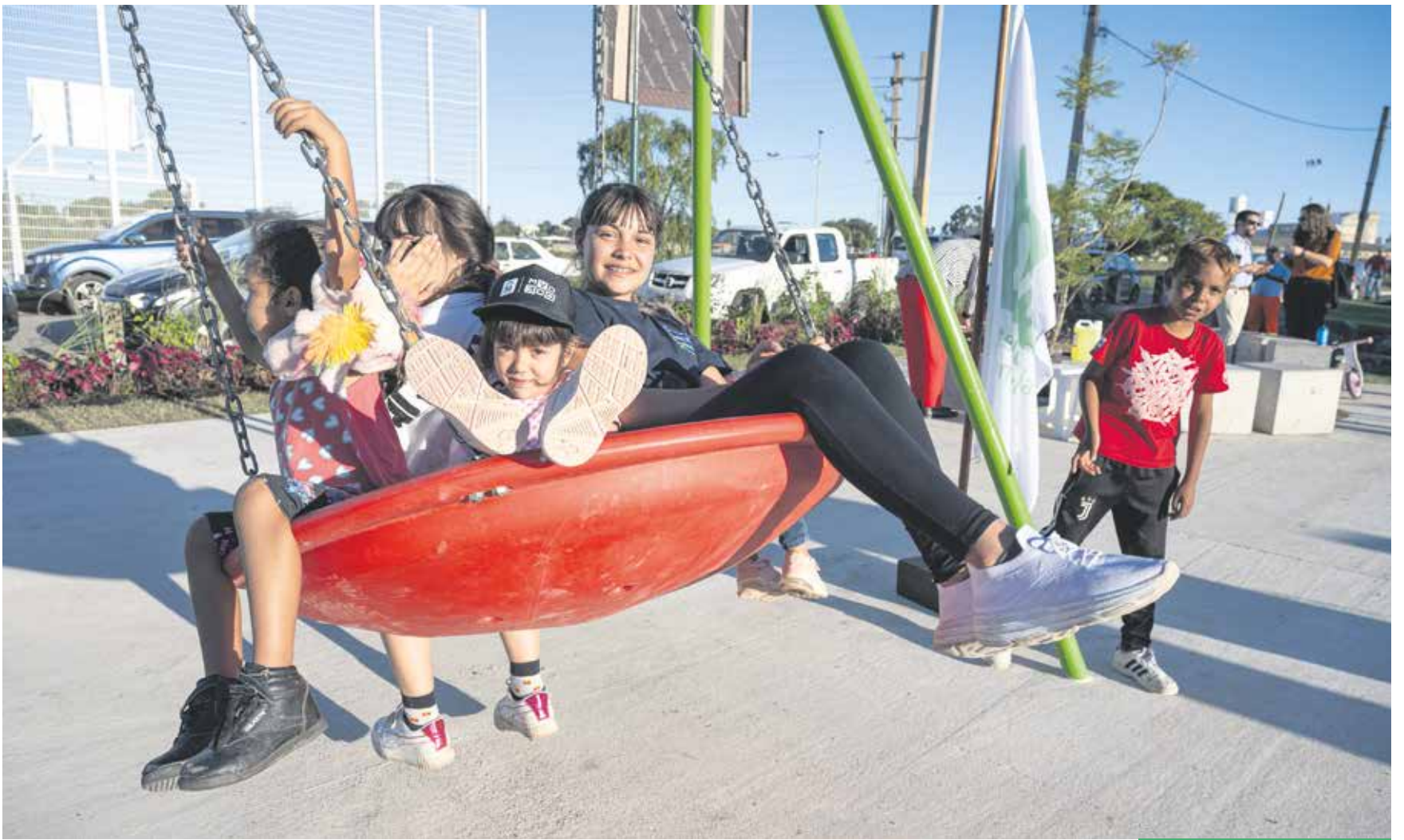
Inauguración de la plaza Parque Guaraní en un espacio recuperado como parte del programa Áreas Liberadas.

En lugares recuperados por el programa Áreas Liberadas se construyeron plazas que son disfrutadas por la ciudadanía. Ese proceso se dio en barrios como Los Milagros, Santiago Vázquez, Bajo Valencia-Casabó, Parque Guaraní y Cerro, entre otros.