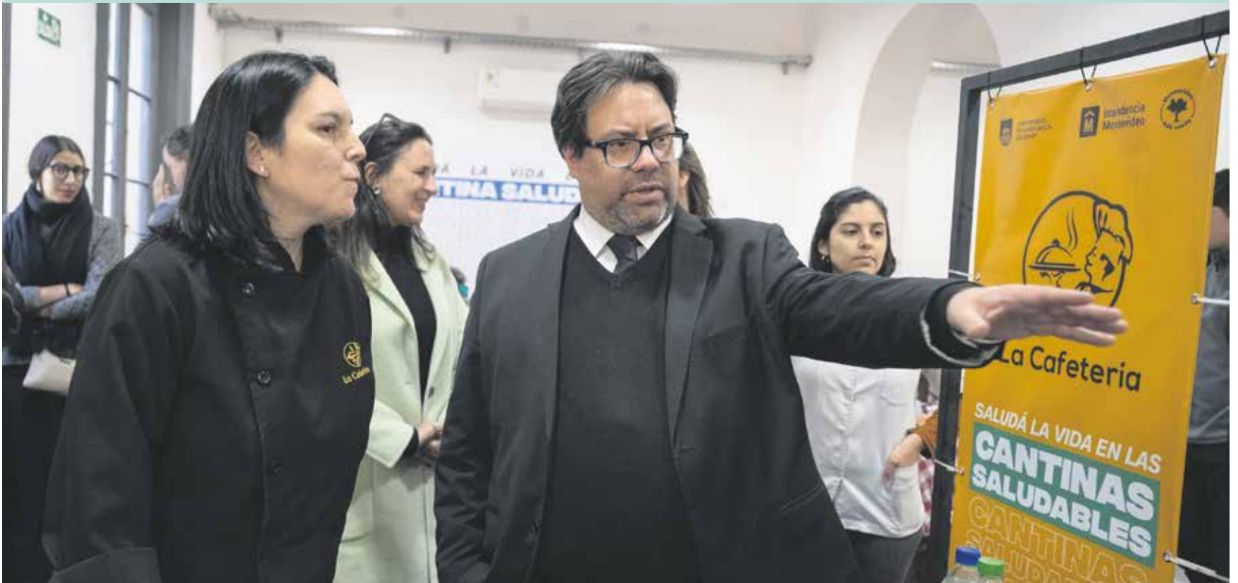
Cantina saludable en Campus Luisi Janicki.

Tres dependencias de la Universidad de la República recibieron la certificación del programa de la IM que busca fomentar una oferta gastronómica saludable en los recintos públicos.