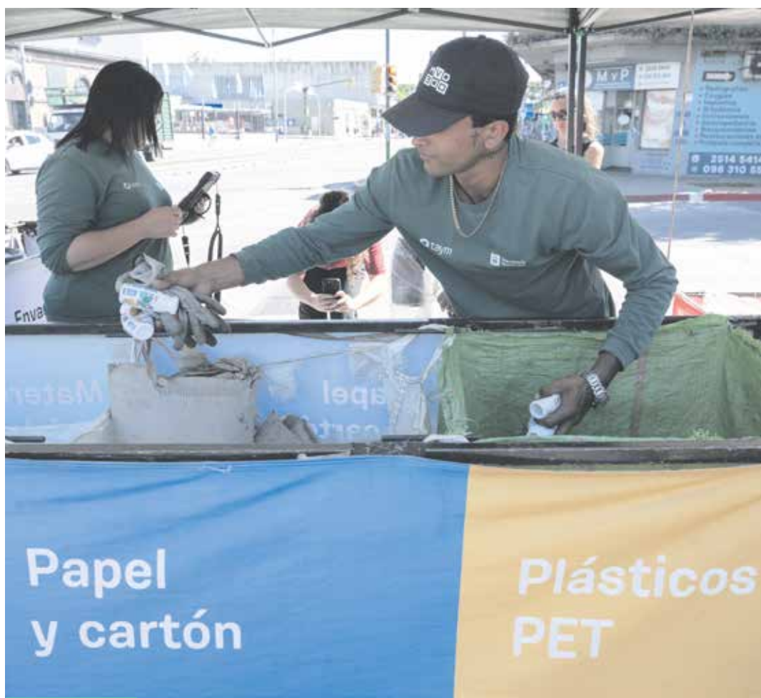
Ecocentro móvil 8 de Octubre y Vicenza.