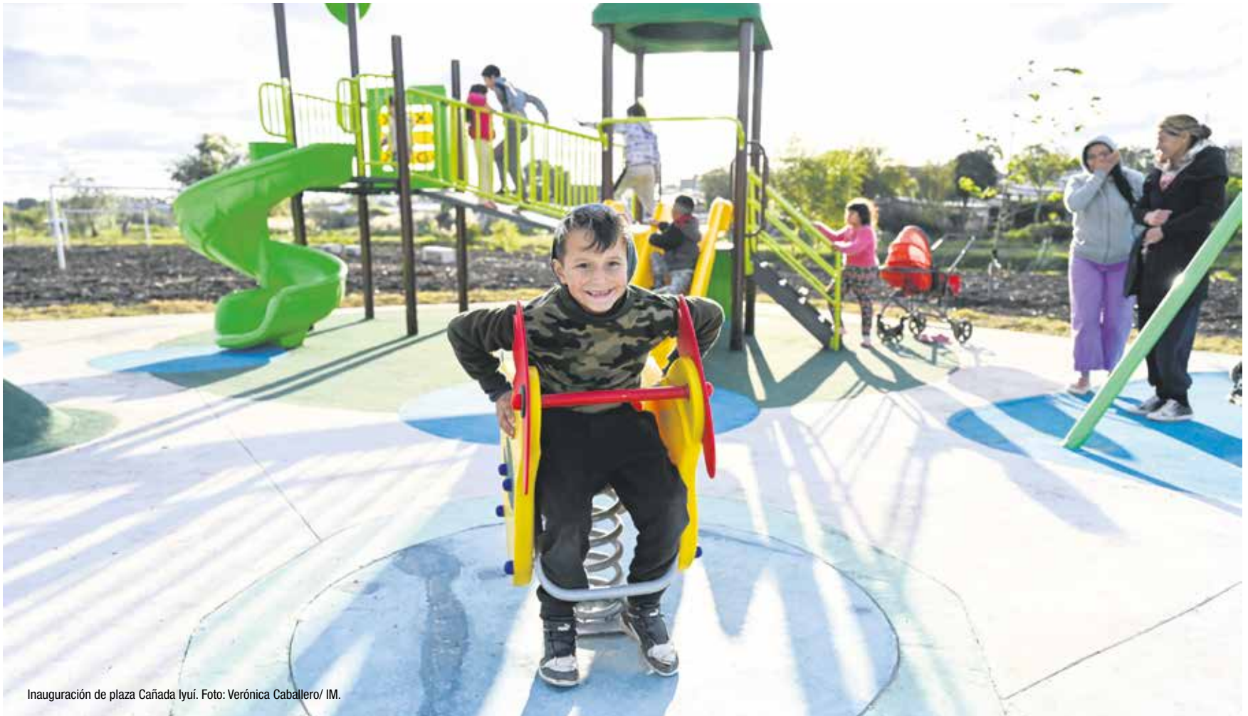
Inauguración de plaza Cañada Iyúí.