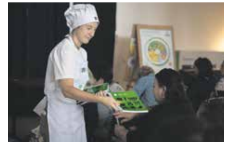
Actividad de Cocina Uruguay en el Centro Cultural Alba Roballo.

Las propuestas de Cocina Uruguay nunca se detienen. El programa de educación alimentaria de la Intendencia de Montevideo sigue acercándole a la gente sus actividades, que buscan fomentar hábitos alimenticios saludables, indispensables para que todas las personas disfruten de una mejor calidad de vida. Todas son de acceso libre y gratuitas, y están dirigidas por un equipo de licenciados y licenciadas en nutrición, así como por cocineros y cocineras.