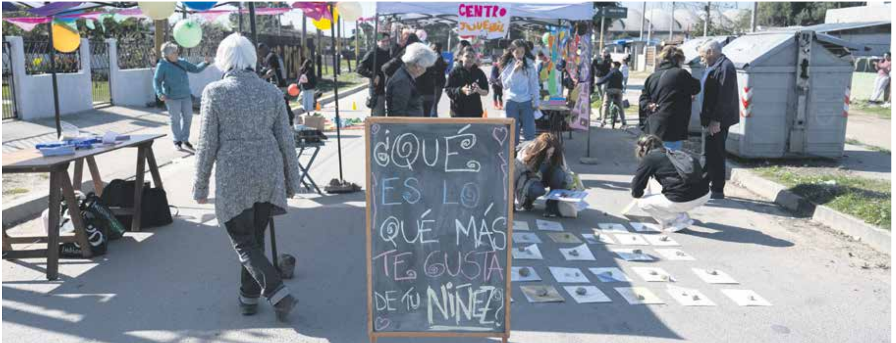
Actividades durante una jornada de Peatonales Barriales en Montevideo.

Varios municipios de Montevideo serán escenario de jornadas llenas de actividades culturales, recreativas y lúdicas que fomentan el encuentro en calles propuestas por la ciudadanía.