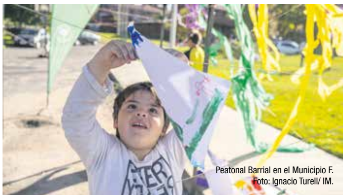
Peatonal Barrial en el Municipio F.

Durante junio hay varias fechas programadas, que recorrerán distintos puntos de Montevideo. Habrá en los Municipios CH, F y G, por citar algunos ejemplos. Entre las actividades previstas figuran juegos, actividades deportivas, ferias, shows musicales, sorteos, meriendas compartidas y acciones especiales por celebraciones, como las que habrá por el Día de los abuelos y las abuelas y los 30 años del barrio 17 de junio.