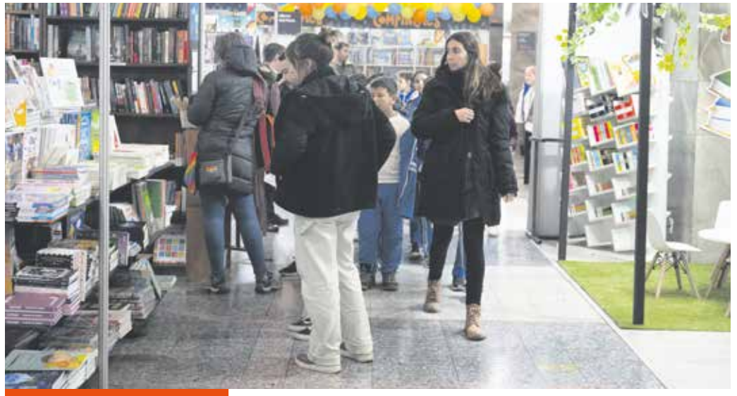
Feria del Libro Infantil y Juvenil 2025. Foto: Verónica Caballero/ IM.

Son muchos los argumentos que confluyen para testimoniar el inmenso valor de la Feria del Libro Infantil y Juvenil, a cuya edición 2025 le quedan unos pocos días para disfrutar.