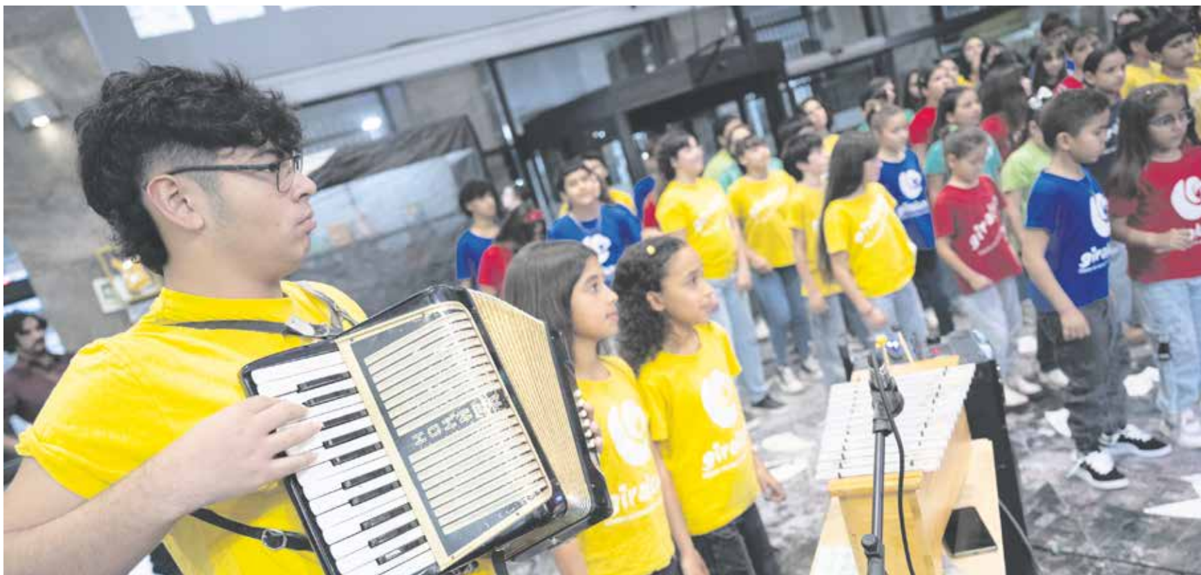
Actividad musical durante la FERIA del Libro Infantil y Juvenil.

Desde que abrió sus puertas una multitud ha visitado las propuestas gratuitas que se desarrollan en la Intendencia de Montevideo como parte de la 23ª edición del evento, que concluirá el domingo 8 de junio.