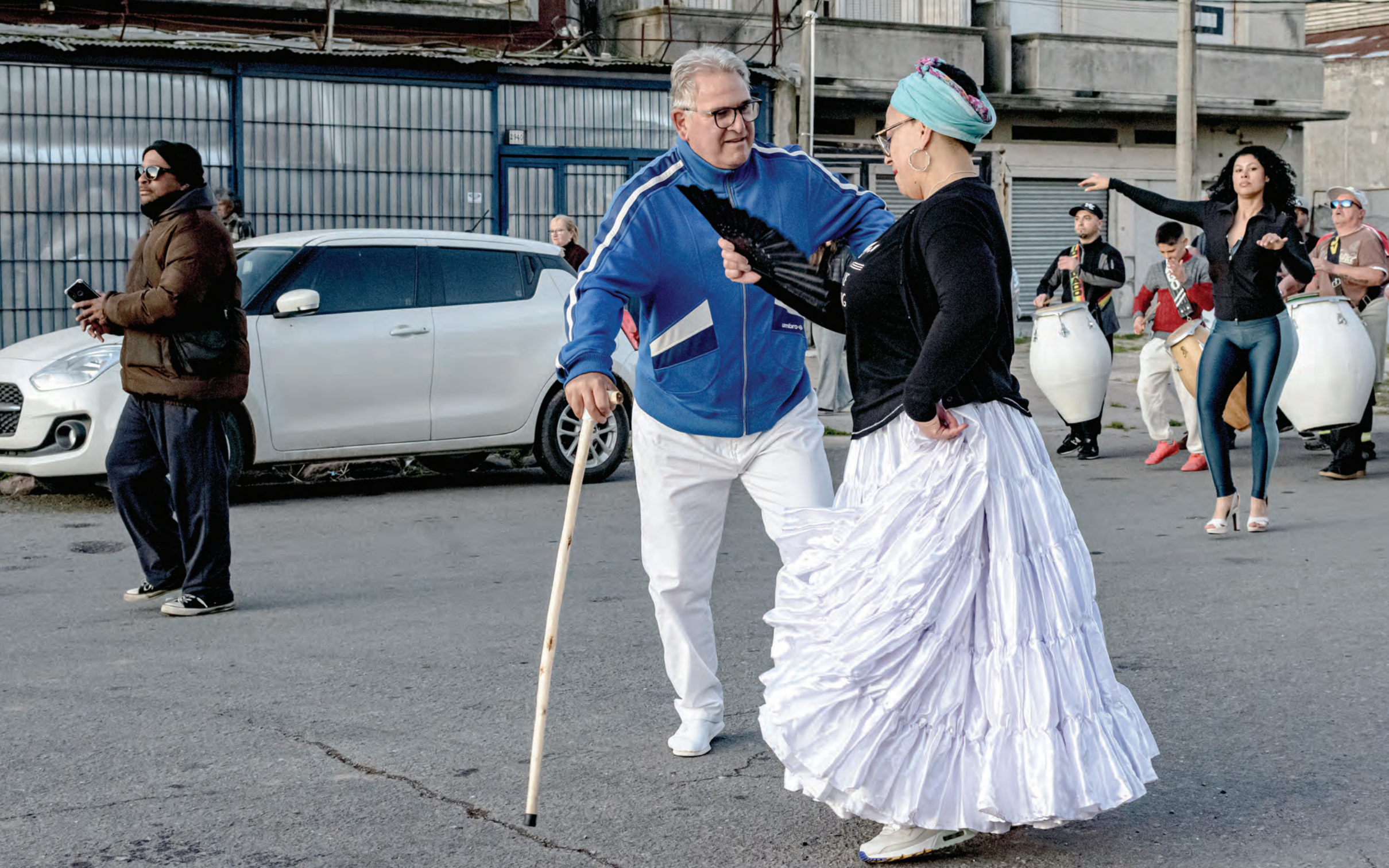
Salida de una comparsa en las inmediaciones del ex Mercado Modelo, setiembre de 2023. Los toques de tambor y bailes del candombe: pieza clave en el mapa sonoro-musical de Montevideo, fuente de múltiples trasvases a la canción popular, tanto en sus músicas como en sus letras.