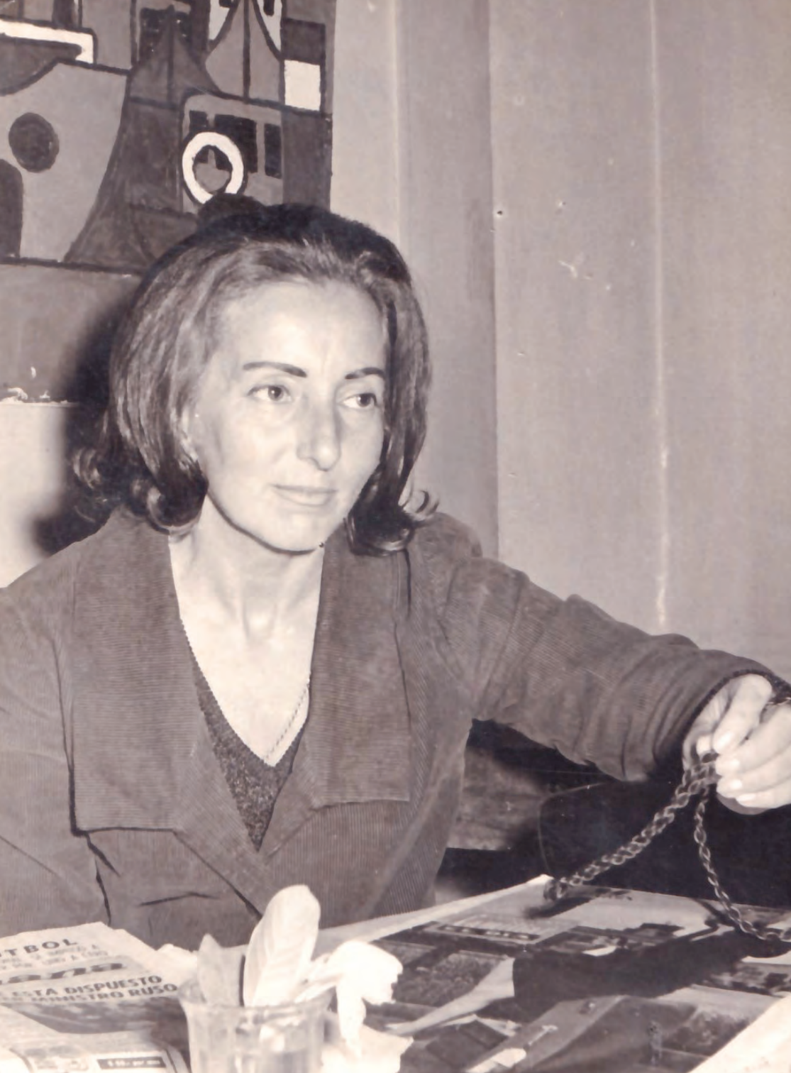
Retrato de Idea Vilariño. Taller de Fotografía diario Época . Montevideo: Editorial Independencia S. A., s/f. Digitalización de la copia en colección particular de Pablo Rocca.