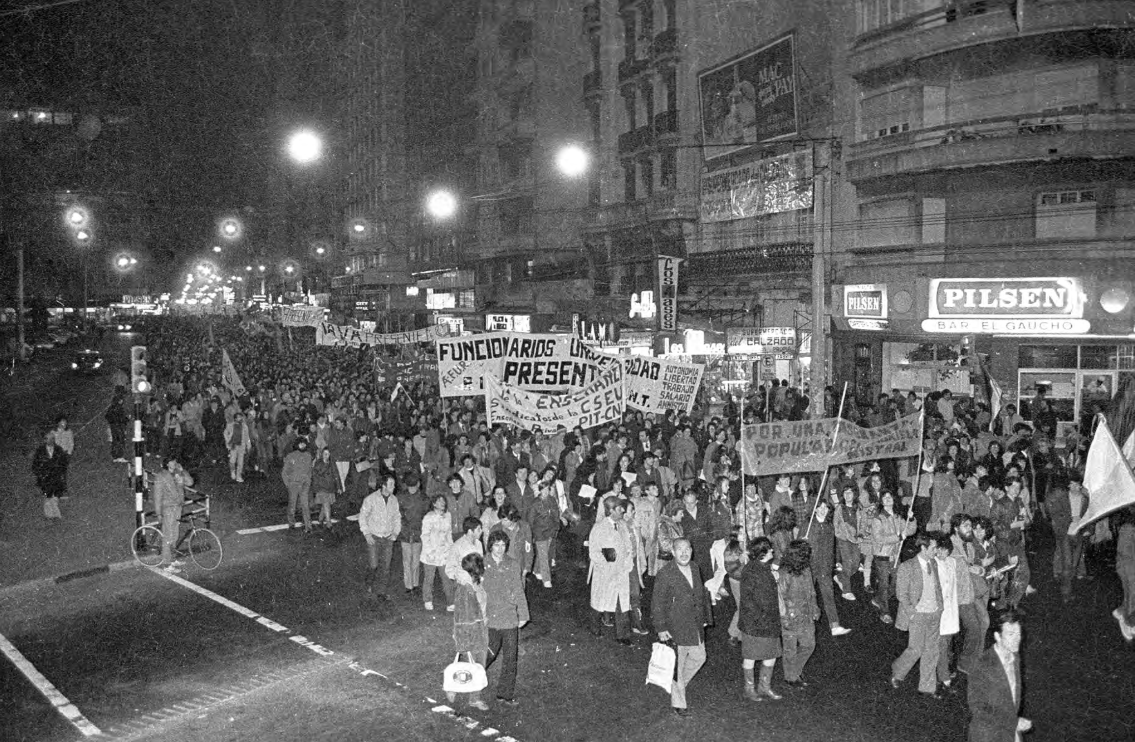
Marcha de la Enseñanza, avenida 18 de Julio y Dr. Javier Barrios Amorín, 28 de setiembre de 1984.

Las movilizaciones en defensa de la educación pública, marcaron las décadas de 1980 y de 1990. Implicaron experiencias importantes de participación para estudiantes, docentes y familias.