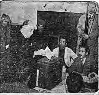
VOTA HEREMIA. — Hace más de ochenta años que el Uruguay es un país libre y democrático. Pero entre los ciudadanos que hoy los más votados — los uruguayos — con el voto, con el voto, con el voto.