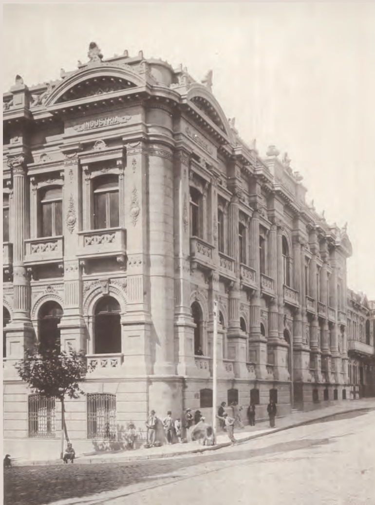
Ateneo. Alrededor de 1900. Ed. J. Ferrazini. Biblioteca Nacional de Uruguay. Colecciones digitales. Álbum de Montevideo.

El Ateneo de Montevideo, fundado en 1886, fue un espacio de sociabilidad política y de activa vida cultural en la ciudad entre finales del siglo XIX y las primeras décadas del XX.