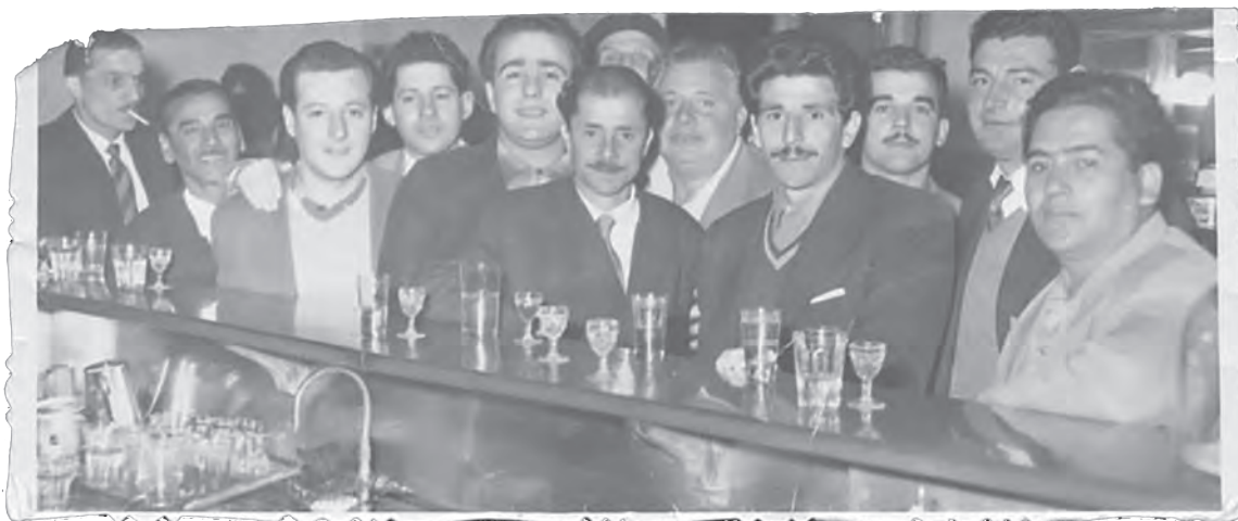
Integrantes de la Comisión de Fomento de Aires Puros, alrededor de 1950, sin datos de autoría. Fondo Particular Aires Puros, n.º 20, CdF, IM.

Las asociaciones barriales de vecinos y vecinas fueron un ejemplo de gestión participativa. Tuvieron como antecedente a las comisiones auxiliares del municipio, que funcionaron hasta mediados de la década de 1920. Hacia finales de la década siguiente surgieron varios clubes y comisiones de fomento en la ciudad, que expresaron formas diferentes de participación, alejadas, de alguna manera, de lo partidario (Nicolás Duffau, De urgencias y necesidades. Los sectores populares montevidianos a través de la documentación de una asociación vecinal: el caso de la Comisión Fomento Aires Puros (1938-1955) . Montevideo: ediciones Abrelabios, 2009, pp. 78-90).